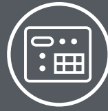
Industriemaschinen und Zubehör