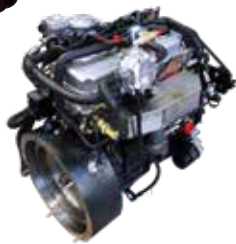
LPG Motor G424P(E)