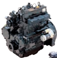
Diesel Motor 4TNE94L